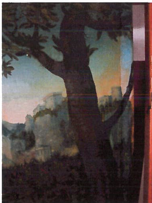
Detalje under rensningen for den gulfarvede fernis.

Farvelaget blev rensede for fernis med Ethanol 96%, hvorved også de små retoucher blev fjernet. I himlens højre og venstre side blev det besluttet at fjerne den gul -orange overmaling. Dette blev gjort mekanisk med skalpel under stereomikroskop. Den lyse blå farve under viste sig at være meget velbevaret.