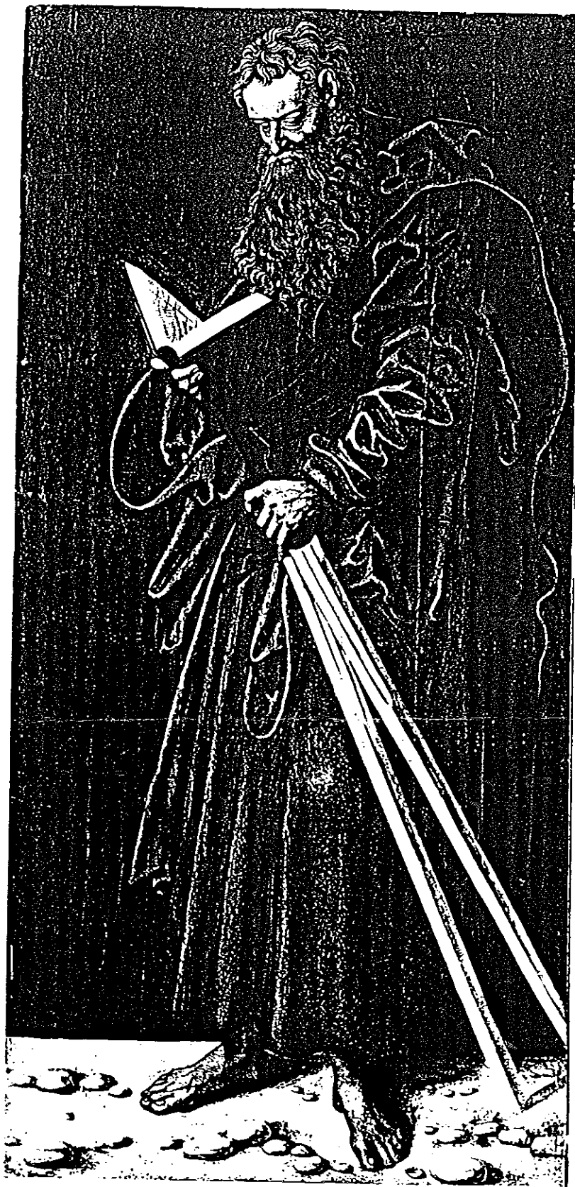
MNR 939 CRANACH S. Paul

Delivered for the Martin (1. 10. 3. 92.)